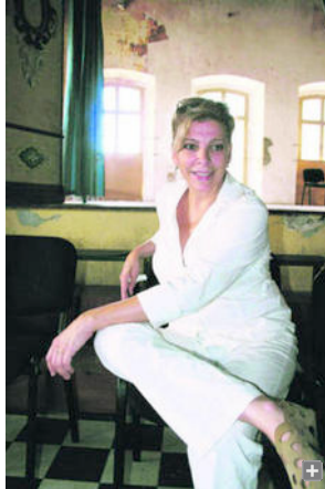
Kiti Mánver ganó un Goya como Mejor Actriz de Reparto por la película.

Con la oreja pegada al teléfono y zurciendo calcetines, una de las protagonistas de la obra Tres , Kiti Mánver, ofrece una entrevista a Diario de Almería con motivo del XXXIII Festival de Teatro de El Ejido. Esta representación, que será una de las que clausuren la muestra, está teniendo buena acogida por los distintos teatros españoles. La intérprete es una de las imprescindibles en el panorama español de cine, teatro y televisión. Ha trabajado con directores de la talla de Pedro Almodóvar, Álex de la Iglesia y Garcí, entre otros. En teatro ha realizado multitud de personajes y en la televisión ha participado en series como Historias de la puta mili , Menudo es mi padre , Juntas pero no revueltas... Este año llega al certamen para cosechar otro éxito en su carrera.